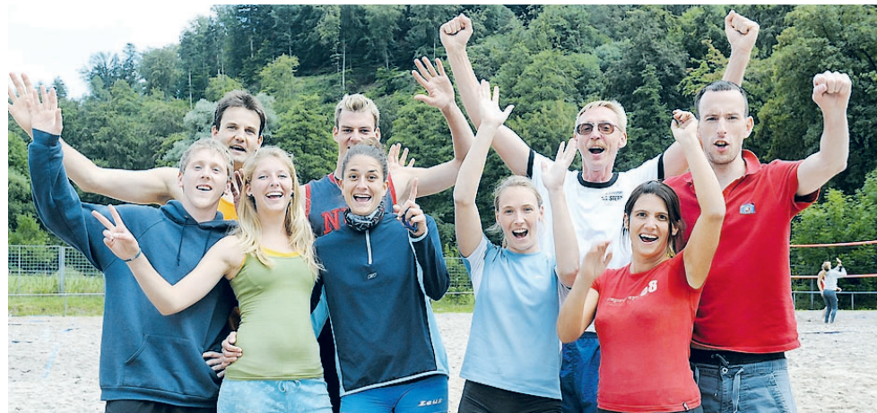
Schippische und Förmsche (rechts) sind einfach nicht zu toppen: Auch die Weinheimer „Next Generation“ (links) konnte dem Vorjahressieger beim 7. Woinemer Quattro-Mixed nicht gefährlich werden.